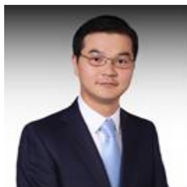
万江 | 合伙人 法学博士

to the administration directly under the State Council, and the AML enforcement function is included in the market supervision system. We look forward to the strengthening of development of China's AML enforcement system and law enforcement authority. And becoming the strength in support of the implementation of the strategic objective of "basic position of the competition policy."